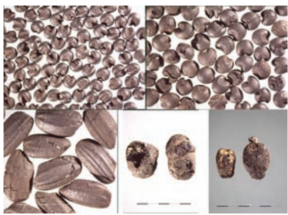
二里头遗址出土的五谷(粟、黍、水稻、大豆和小麦)

二里头时期的农业发展主要体现在以二里头文化为代表的中原地区。早在龙山时代形成的多品种农作物种植制度此时得到了进一步完善,中原地区的农业仍以粟和黍两种小米为主,但水稻比重增加,大豆广泛种植,小麦普遍出现。多品种农作物种植制度有利于提高限定区域的农业的生产总值,减轻各种自然灾害对农业