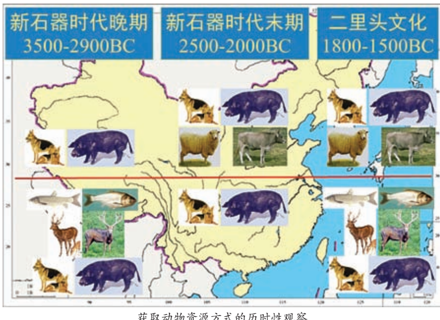
获取动物资源方式的历时性观察

2. 古DNA研究进一步揭示中国家养黄牛和绵羊的出现和传播过程。通过对东北地区、黄河上游和中游地区多个遗址出土的牛的DNA研究结果证实,距今5000多年前开始逐步出现在中国境内的黄牛属于西亚起源的谱系T,沿黄河流域由西向东逐步传播,在4000多年前已经到达黄河下游地区。但值得关注的是,东北地区的后套木嘎遗址在距今5000多年前还存在原始牛(谱系C)与黄牛(谱系T)并存的现象,为我们探寻黄牛由北向南的传播路线提供新的启示。中国的野羊与家养绵羊(谱系A)没有遗传关系,这表明中国古代的家养绵羊也是由境外传入的。