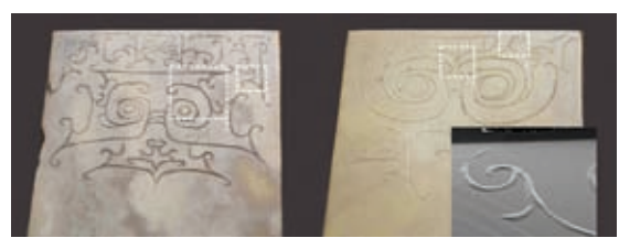
两城镇遗址出土玉圭1:220的兽面纹及阴刻痕

文明起源阶段,玉器工艺技术在地区的发展有先后或快慢的差异,但整体而言,具有两个明显的特点:连续性发展和阶段性变革。课题组采用微痕复制和扫描电镜(简称SEM)微痕观察方法准确地判断技术类型。通过实验考古和微痕对比分析,进一步判断加工工具的材料性质、使用功能等技术要素,同时探讨各地区玉器的使用程度和材料来源,为探索早期玉石之路等文化交流研究提供科技支撑。课题组在玉器工艺技术和“物”来源两个方面取得了以下研究成果: